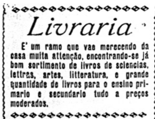
Figura 3: Anúncio da livraria

A Casa Livro Azul não destacava nos livros que anunciava uma linha editorial, promovendo autores já consagrados da literatura brasileira ou portuguesa. Os autores novos que surgiam, principalmente locais, tinham suas publicações impressas pela livraria sob encomenda, publicações estas até reeditadas algumas vezes. Também não possuía um projeto definido ligado à formação do leitor, que o chamasse para lançamentos de livros, de novos autores ou que destacasse em suas propagandas temas específicos para homens, ou para mulheres, como faziam algumas editoras do Rio de Janeiro ou mesmo São Paulo, como pude observar em outros anúncios de livrarias. Que livros, então, teria ela oferecido a esta sociedade, além dos cartões, recibos, circulares, memorandos, livros em branco e de faturas? Que livros venderia?