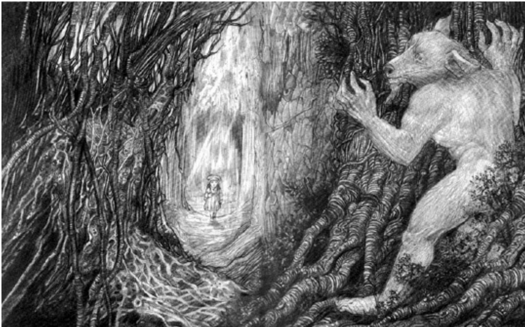
3. Ilustração de Rui de Oliveira para o livro “Chapeuzinho Vermelho e outros contos por imagem”.

Um ótimo exemplo dos chamados “livros de imagens” é "Chapeuzinho Vermelho e outros contos por imagem" que contém três histórias: "João e Maria", "Chapeuzinho Vermelho" e "O Barba Azul" adaptadas por Luciana Sandroni, a partir dos originais de Charles Perrault e dos irmãos Grimm, e ilustradas por Rui de Oliveira. Este livro apresenta primeiro os três contos escritos e, em seguida, a seqüência de imagens desses contos. É curioso observar que, embora Luciana Sandroni e Rui de Oliveira trabalhem com os mesmos contos, não existe, necessariamente, uma relação entre a produção de um e outro. Ou seja, Rui de Oliveira não faz suas ilustrações seguindo à risca o que trata o texto traduzido por Luciana. Entre outras coisas, esse também é um diferencial que permite ao leitor conhecer além do próprio texto, um pouco do próprio imaginário do ilustrador.