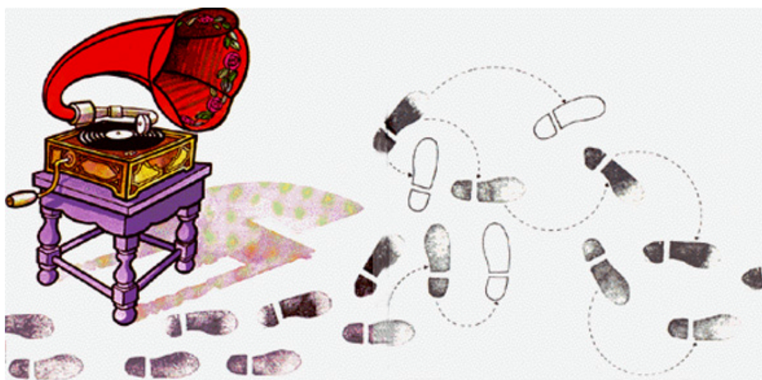
4. Ilustração de Juarez Machado para o livro “Ida e Volta”.

A presença da personagem é notada pelas marcas dos pés e sapatos que são deixadas no trajeto; e pelas alterações sofridas em todo o ambiente narrativo por onde ela passa. O leitor pode notar essas mudanças em detalhes: o cabide vazio no armário de roupas; as migalhas de pão deixadas sobre a mesa do café da manhã; a maçã que é deixada em um cesto de lixo na rua; o vaso de flores retirado da estante de um vendedor e logo depois dado a uma velhinha etc. A linguagem visual deste livro, sem palavras, possibilita leituras diversas e permite ao leitor ler a imagem e construir, a partir dela, outras narrativas.